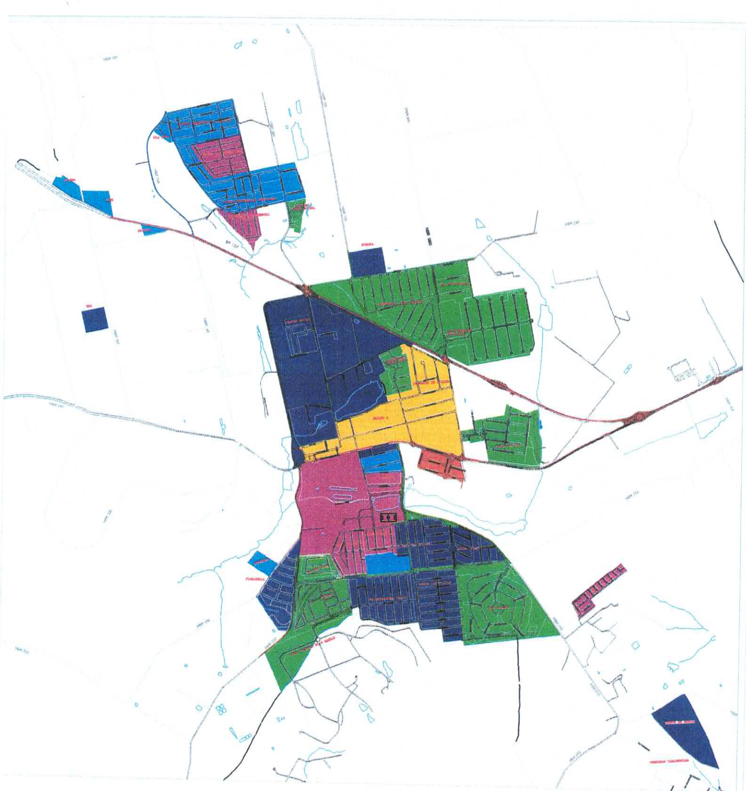
ZONA DE EXPANSÃO 1 Chácaras Camanducaia Escala 1/10.000